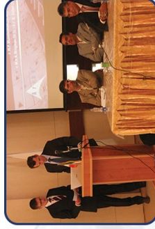
اولین همایش مدیریت پروژه های ساخت ۱۳۹۰

این همایش بنا دارد این فرصت ها را برای مخاطبین خود ایجاد کند: • آشنایی با مهارت ها ، دانش ، ابزار و تکنیک های نوین در مدیریت پروژه های ساخت. • تعامل ، هم اندیشی و بهره گیری مدیران و کارشناسان حوزه مدیریت پروژه های ساخت. • آشنایی و استفاده از خدمات شرکت های مشاوره در زمینه مدیریت پروژه .