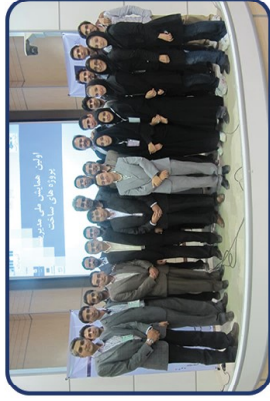
اولین همایش مدیریت پروژه های ساخت ۱۳۹۰

رویداد برگزاری "دومین همایش مدیریت پروژه های ساخت" با ایجاد شبکه‌ای تخصصی متشکل از اساتید، دانشگاه‌ها، انجمن‌های صنفی و سازمان‌های پروژه محور، به دنبال اهداف و رسالت‌های زیر می باشد: