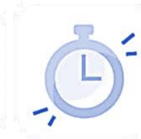
کار در شرایط پرفشار