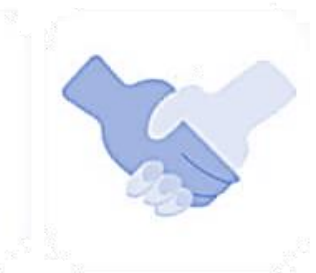
قدرت مذاکره و فن بیان